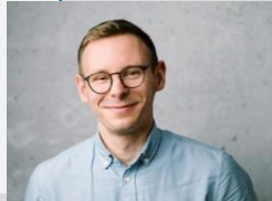
Lennart Eiltzolt Sana Einkauf und Logistik GmbH